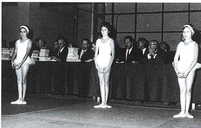
■ Gala de danse des Amis du foyer, le 10 octobre 1971.