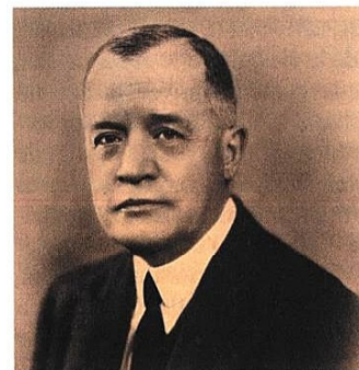
■ Élu maire de Boulogne en 1919, André Morizet associe les quartiers de Boulogne et Billancourt en 1926.

■ Extrait du Journal officiel du 4 décembre 1925.