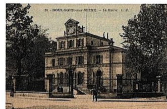
■ L'ancienne mairie de Boulogne-sur-Seine.

En ce lundi 11 janvier 1926, malgré une vague de froid annoncée pour les prochains jours dont on peut déjà ressentir les effets, la population est nombreuse dans les rues de la ville. Sur la chaussée, les tramways font tinter leur klaxon lorsqu'ils croisent les voitures et les camionnettes des blanchisseurs qui vont livrer le linge propre. Sur les trottoirs de la route de la Reine, parmi la foule des piétons qui marchent d'un pas assuré, trois silhouettes se détachent : il s'agit de trois vieillards, en chemin vers le pont de Saint-Cloud. Appuyés sur leur canne et casquette vissée sur la tête, ils cheminent paisiblement. Arrivés à l'angle de la rue de Billancourt, ils décident de faire un arrêt sur un banc près des grilles du parc de la Mairie. Ce bâtiment aux volets verts et surmonté d'une horloge, nos trois compères l'ont connu à l'époque où il appartenait encore à