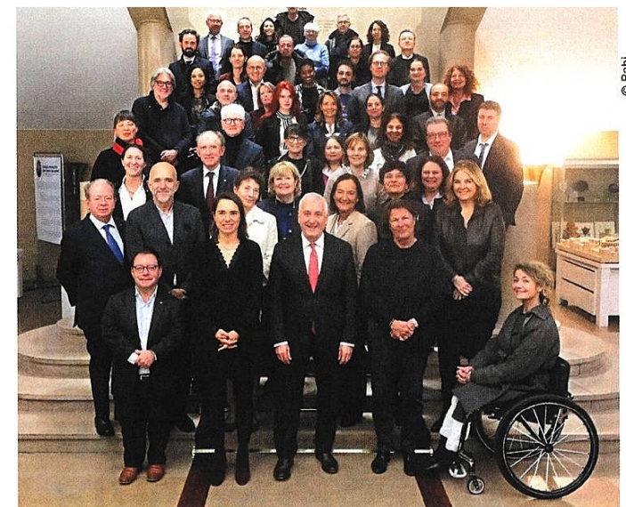
■ Lors du conseil municipal du jeudi 4 décembre dernier, l'ensemble des élus a célébré le centième anniversaire, jour pour jour, de la publication au Journal officiel de la République française du nouveau nom de Boulogne-Billancourt.