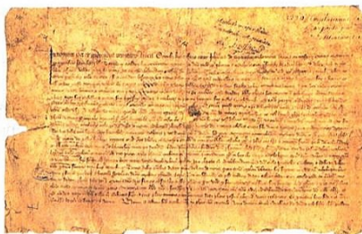
■ Datant de 1320, ce manuscrit marquant la naissance de Boulogne est la plus ancienne archive municipale.