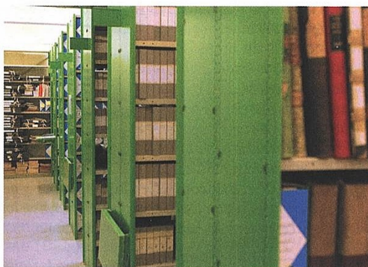
■ Hôtel de ville, les Archives en 2025.